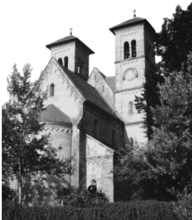
Münsterkirche in Klosterreichenbach

Der Grundstein für das ehemalige Kloster Reichenbach wurde 1082 von Benediktinermönchen aus Hirsau gelegt. Schon 1085 konnte der Bischof von Konstanz das Kloster weihen. Die Münsterkirche hat ihre heutige Gestalt seit Beginn des 13. Jahrhunderts. Die Schlichtheit des Kirchenschiffs überrascht.